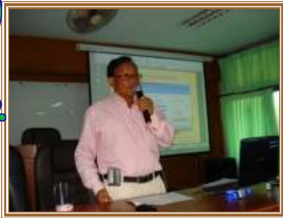
บ้านหนองไฉ้วัง