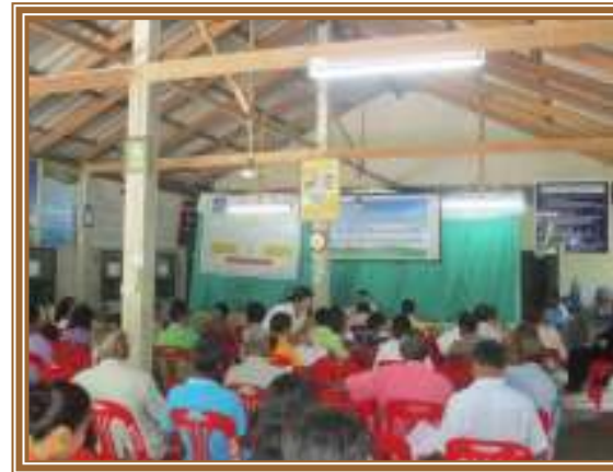
บ้านจันทาก